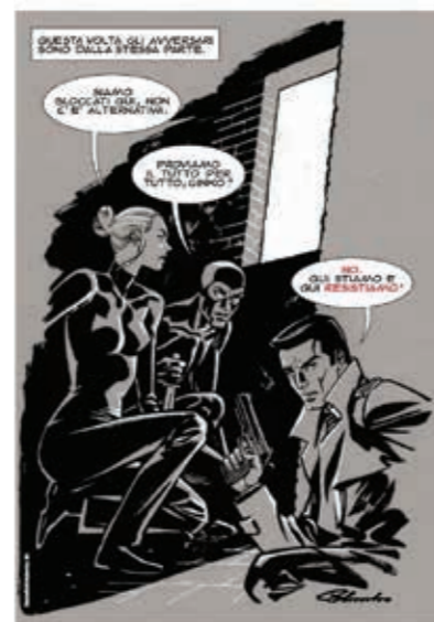
L'illustrazione di Giuseppe Palumbo apparsa su Robinson

Per confortare le lunghe ore dei lettori chiusi in casa, diversi editori hanno condiviso liberamente molte loro pubblicazioni (Gipi anche il suo film Il ragazzo più felice del mondo ), come Shockdom che ha reso disponibile gran parte dei titoli sulla piattaforma Yep Comics! e Cocconino Press che con "Una Quarantena di Fu-